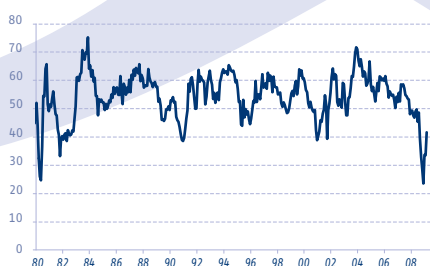
ÉTATS-UNIS: ISM MANUFACTURIER, COMPOSANTE NOUVELLES COMMANDES