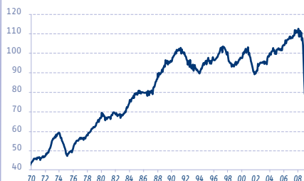
JAPON: PRODUCTION INDUSTRIELLE, VOLUME

> A surveiller : Globalement, les derniers chiffres de la zone euro sont un peu décevants par rapport aux publications dans le reste du monde. Alors qu'ailleurs une nette inflexion par rapport aux points bas semble se dessiner, on ne peut guère parler que d'une stabilisation en Europe. Le déstockage ayant commencé beaucoup plus tard dans la zone euro qu'aux Etats-Unis, il est probable que la conjoncture y reste médiocre plus longtemps qu'ailleurs, repoussant la reprise au dernier trimestre de l'année.