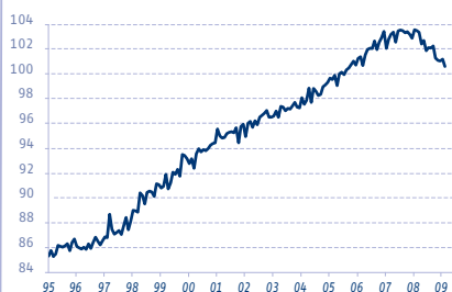
ZONE EURO: VENTES DE DÉTAIL, VOLUME

> A surveiller : Les prix de l'immobilier ont baissé de 2 % au mois de janvier et sont maintenant près de 30 % inférieurs à leurs plus hauts de la mi-2006, soit un retour au niveau de 2003. Rapportés au revenu disponible des ménages, les prix ne sont maintenant plus que 20 % au-dessus des points bas atteints en 1997 contre près de 95 % au sommet de la bulle. Le rebond des ventes de maisons neuves et des permis de construire, bien qu'il fasse suite à de très fortes baisses, constitue un premier signe positif.